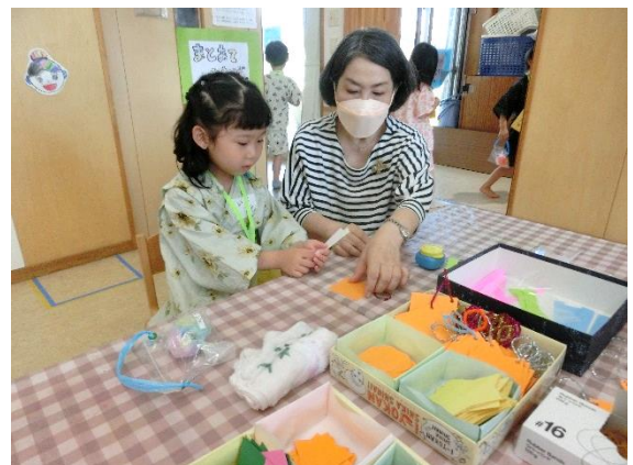
きらきら夏まつりで地域の方と一緒に