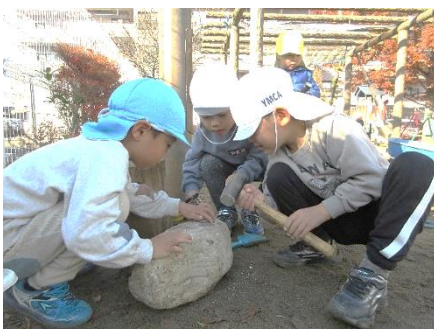
石の研究に夢中 4・5歳児