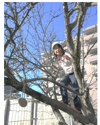
木登りも上手になったよ 5歳児