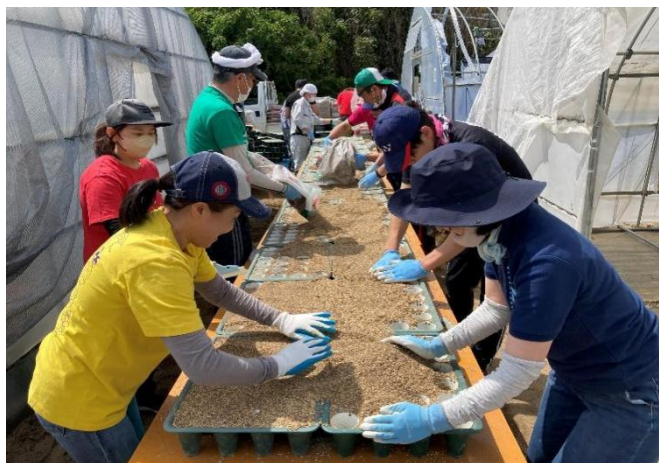
山元町岩佐イチゴ農園ボランティア1