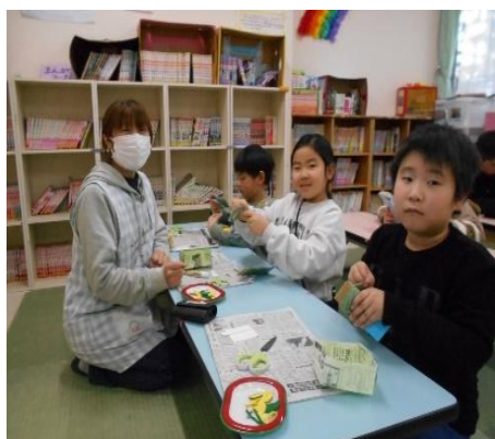
<毛糸でマスコットづくり>