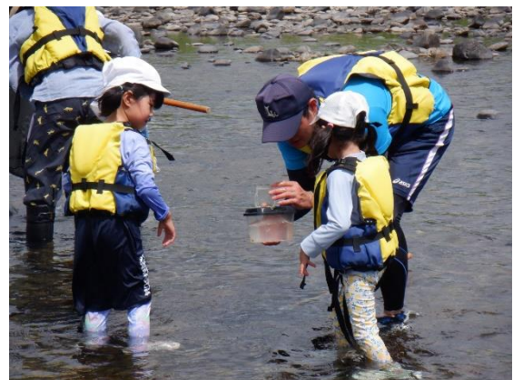
名取川にて川あそび(5歳児)