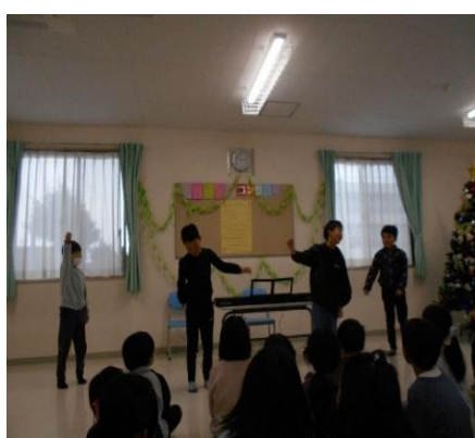
<クリスマスコンサート>