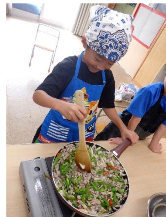
幼児部 収穫したピーマンを使って クッキング