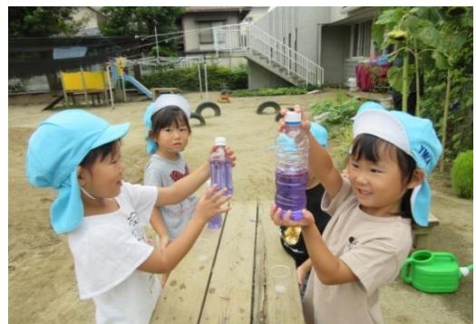
園庭の朝顔で色水あそび（4歳児）