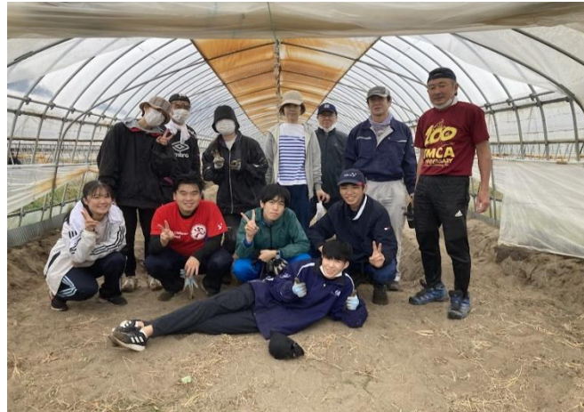
山元町岩佐イチゴ農園ボランティア2