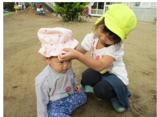
「ぼうし かぶろうね」（3歳児）