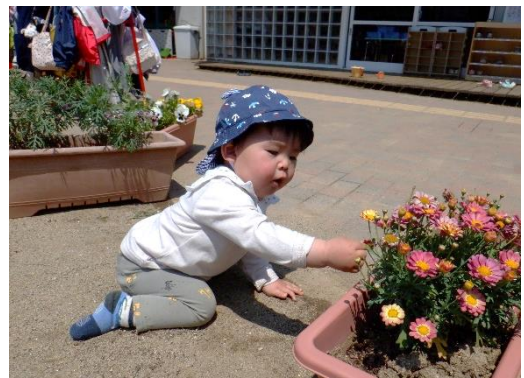
園庭のお花に興味しんしん（0歳児）