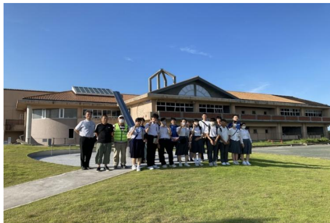
大阪YMCA受託「令和5年度中学生体験学習事業」運営サポート