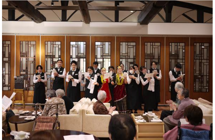
老人ホームでの交流イベント

昨年度、専門学校の入学者回復のために「専門学校検討委員会」が組織され、3年計画を策定、留学生を対象とした新学科の設置、教務課体制の強化、広報手段の見直しなどを計画し第一年目を終えることができた。2024年度より留学生を対象とした国際ビジネス科の開設と共に、増えている留学生志願者対応のため国際おもてなし科の定員も増加させた。結果として、ホテル科入学者は定員には及ばなかったが、トータルとして第一年目の目標である55名の入学者を超える57名の入学者を得るに至った。