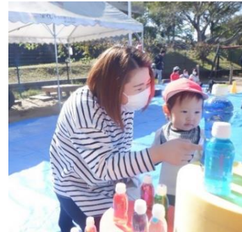
乳児部 久しぶりのわくわくふれあい遊び