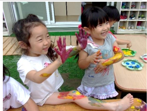
わいわいあそぼうデー 4歳児