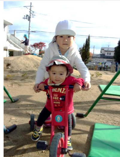
クラスの枠を越え一緒に遊ぶ姉弟